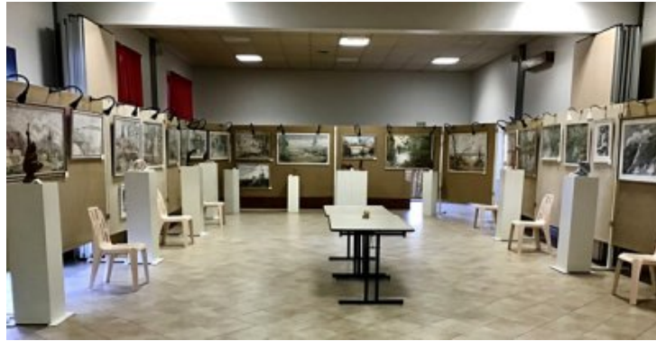
Vue générale de la salle avant le vernissage du 22 octobre « 2022