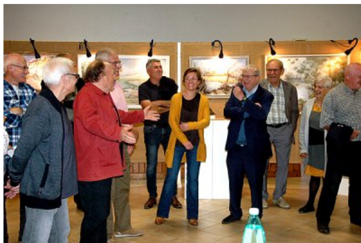
Le vernissage de l'exposition « du pastel à la terre », samedi 22 octobre 2022.